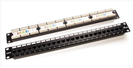
Patch Panel de 24 puertos