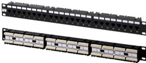
Patch Panel de 24 puertos

Para montaje en Rack 1U Cat5e alimentación de cables Patch Panel, Ethernet RJ45